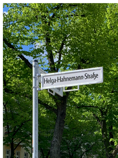
In Niederschöneweide wurde am 18. April 2024 eine neue Straße nach der berühmten Künstlerin Helga Hahnemann benannt.

Eine der höchsten kommunalpolitischen Ehren ist die Benennung einer Straße. Wer fünf Jahre tot ist, dem oder der kann diese Ehre zu Teil werden. Sie wird in der Regel