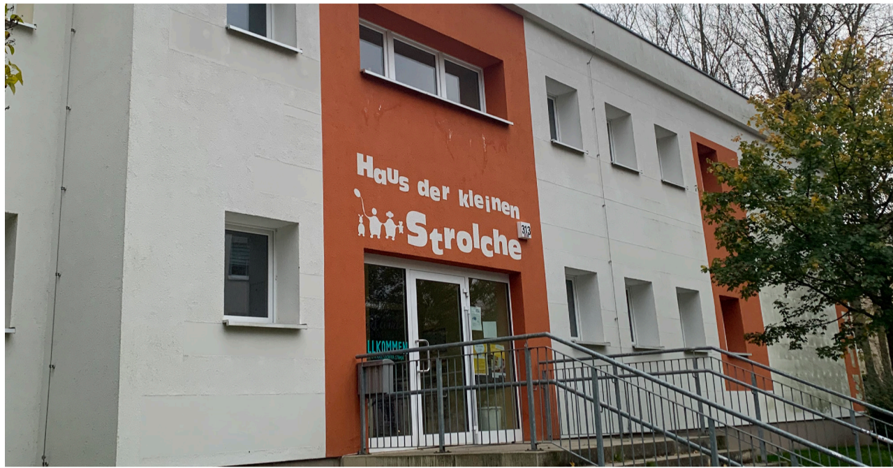
Eine der größten Freuden am Erzieher-Beruf ist es, die Entwicklungserfolge der Kinder zu sehen

Dieses Mal war ich „Haus der kleinen Strolche“ in der Kaulsdorfer Straße. Dort bin ich großartig aufgenommen worden. Der Kita-Eigenbetrieb Südost hat mich mit einer Eigenbetriebs-Jacke ausgestattet, aber ich wäre wohl auch ohne als Erwachsener erkennbar gewesen. Die Jacke jedenfalls war am Ende des Tages voller Buddelkastensand. In der Gruppe, in der ich eingesetzt war, waren drei- bis sechsjährige Kinder. Ich habe bemerkt, wie wichtig es sowohl für die Kleineren als auch für die Größeren ist, dass sie unterschiedlichen Alters sind, weil sie Verantwortung übernehmen und sich auch etwas anschauen. Sie sitzen nebeneinander, basteln und bauen zusammen, sie hören beim Vorlesen zu, sie räumen gemeinsam auf. Faszinierend war wieder, wie die Kinder in der Kita Regeln beherrschen und ihnen folgen. Man merkt da wieder: es ist eine andere Welt: Da wird aufge-