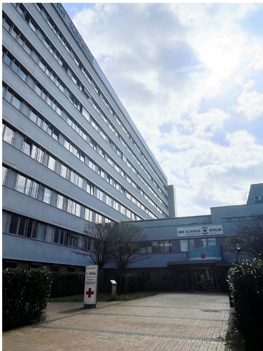
Die Krankenhausreform ist auch für Treptow-Köpenick eine Verbesserung in der Gesundheitsversorgung

Berlin wird in Anpassung an aktuelle Entwicklungen eine Weiterentwicklung des Landeskrankenhauses in 2026 vorlegen – die Auswirkungen des Bundesgesetzes des SPD-Gesundheitsministers Prof. Dr. Karl Lauterbach werden genau bewertet und Gespräche mit den Berliner Krankenhäusern zur konkreten Ausgestaltung ge-