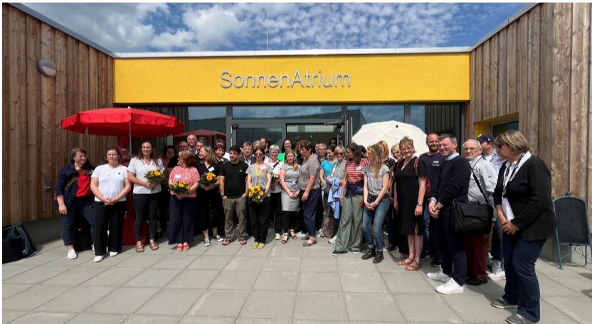
Das SonnenAtrium wurde am 06. Juni 2024 eröffnet

zungsmöglichkeiten. Die bereits vorhandenen Angebote aus der Kita Sonnenschein wie der Kneipp- und Sauna-Bereich und die Familienküche werden im SonnenAtrium weitergeführt und erweitert. Beim Familiensamstag kann man sich im Begegnungszentrum austauschen, den Barfußpfad oder den Raum für neue Ideen nutzen. Projekte aus dem Kosmosviertel wie „Starke Mädchen“, starke Frauen“, welches im SonnenAtrium eine neue Wirkungsstätte erhält und die Projektvorstellung im Viertel seitens des Quartiersmanagements